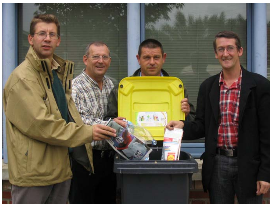
Les représentants à la Communauté de Communes Artois-Flandres