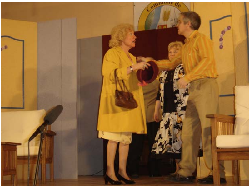
L'politique dins ch'ménache