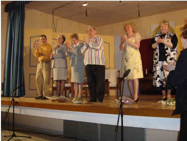
La troupe de 7 comédiens

L'atelier de théâtre patoisant reviendra à Guarbecque avec son nouveau spectacle le samedi 4 novembre 2006. Retenez cette date pour passer une bonne soirée dans la bonne humeur.