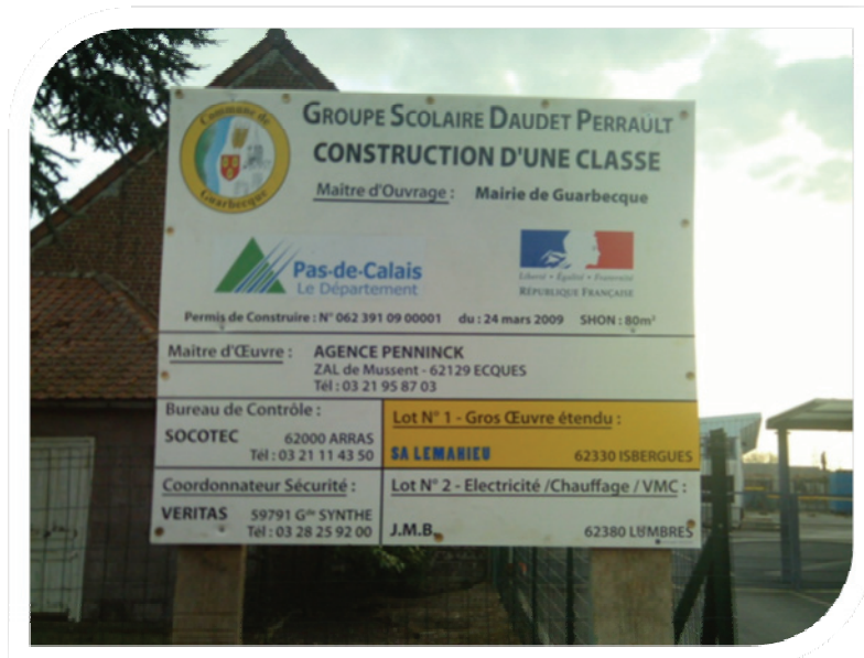
La construction d'une classe à l'école Daudet Perrault a démarré le 15 février, elle sera à la disposition des élèves pour la rentrée de septembre.