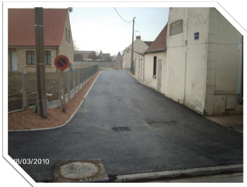
Elargissement (4 m sur 50 m) et réfection d'une partie de la ruelle et du trottoir adjacent (15 m)