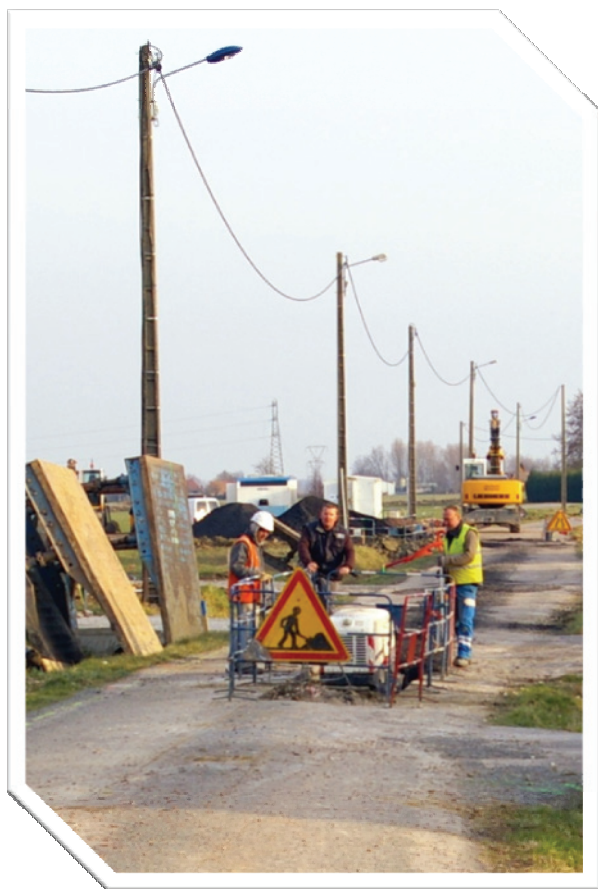
Création de l'assainissement collectif rue du Petit Carlu (120 m) et réfection de la voirie