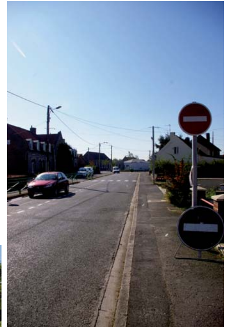
Sens unique à la salle des fêtes