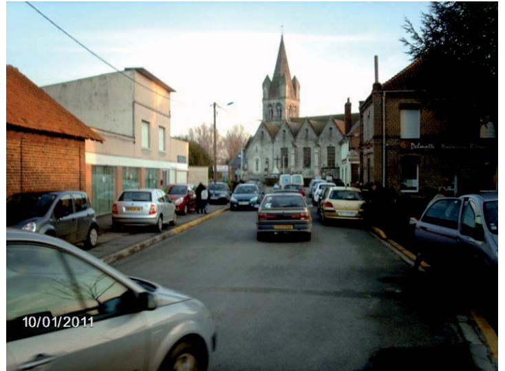
Avant : réel danger à la sortie des écoles