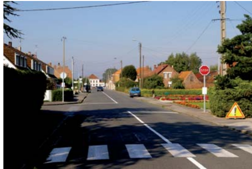
Stop rue du Maréchal Leclerc