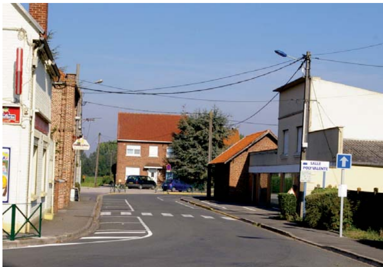
Sens unique vers les écoles