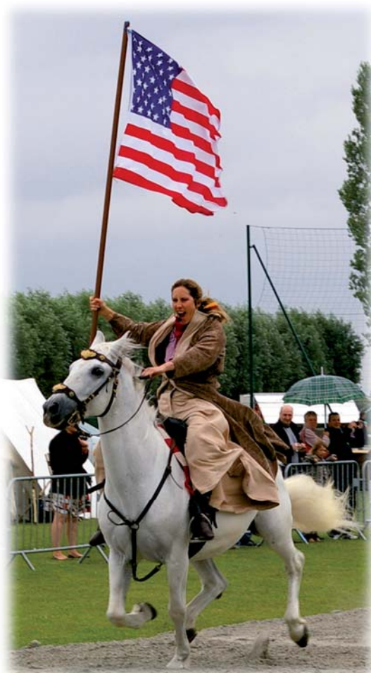
Le président du comité des fêtes.

Notre ducasse se poursuivit les week-ends suivants avec le traditionnel et apprécié Grand Prix cycliste Michel Prins (le 7 ème ), le loto, le goûter des anciens, et finalement la soirée dansante musette et discothèque inter générations. Un grand merci à nos nombreux bénévoles dévoués à l'animation de notre commune.