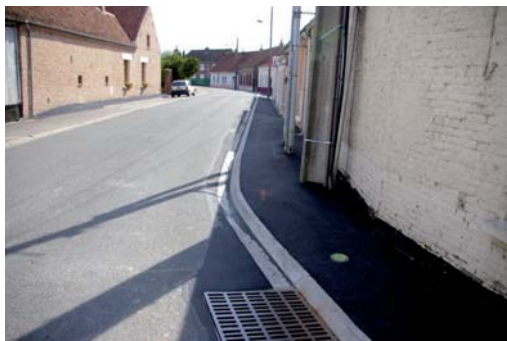
Trottoirs rue des Fusillés

Ces actions seront optimisées dans les semaines à venir pour la sécurité de tous.