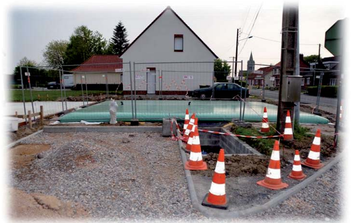
L'installation de la citerne incendie suit son cours.