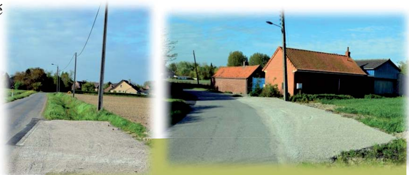
Les 2 refuges sont opérationnels rue du Petit Carlu et rue du Haut Blé.