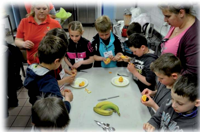
Réalisation de smoothies