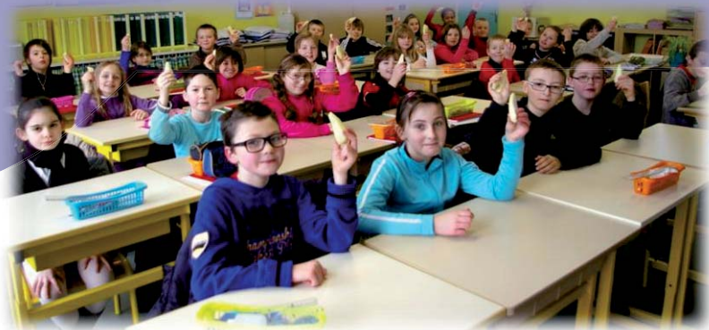
Un fruit à la récré