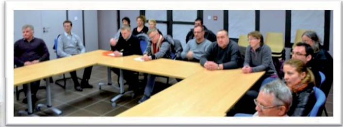
Réunion publique avec les riverains