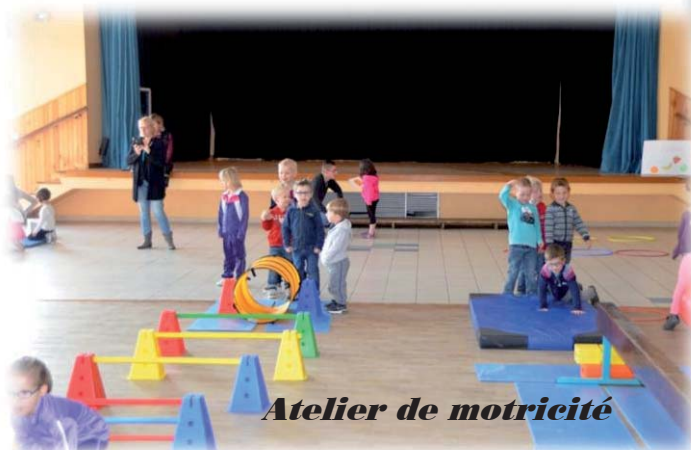
Atelier de motricité