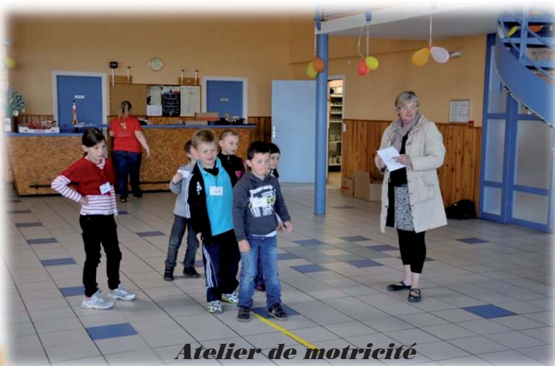
Atelier de motricité