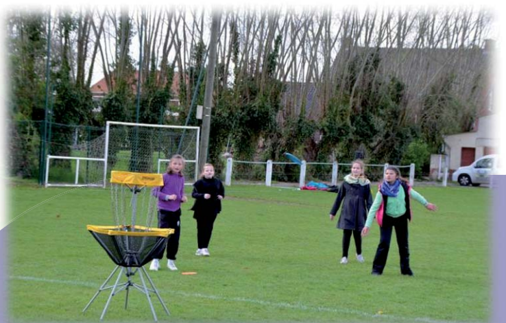
Initiation Disc Golf