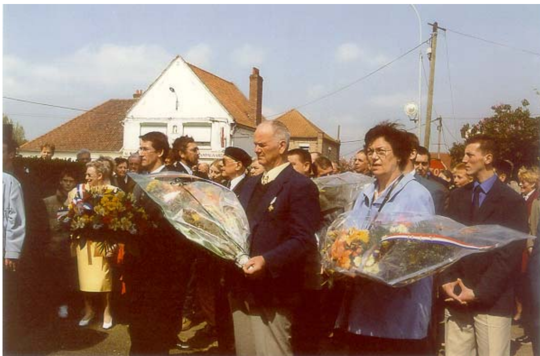
Dépôt de gerbes au monument aux morts