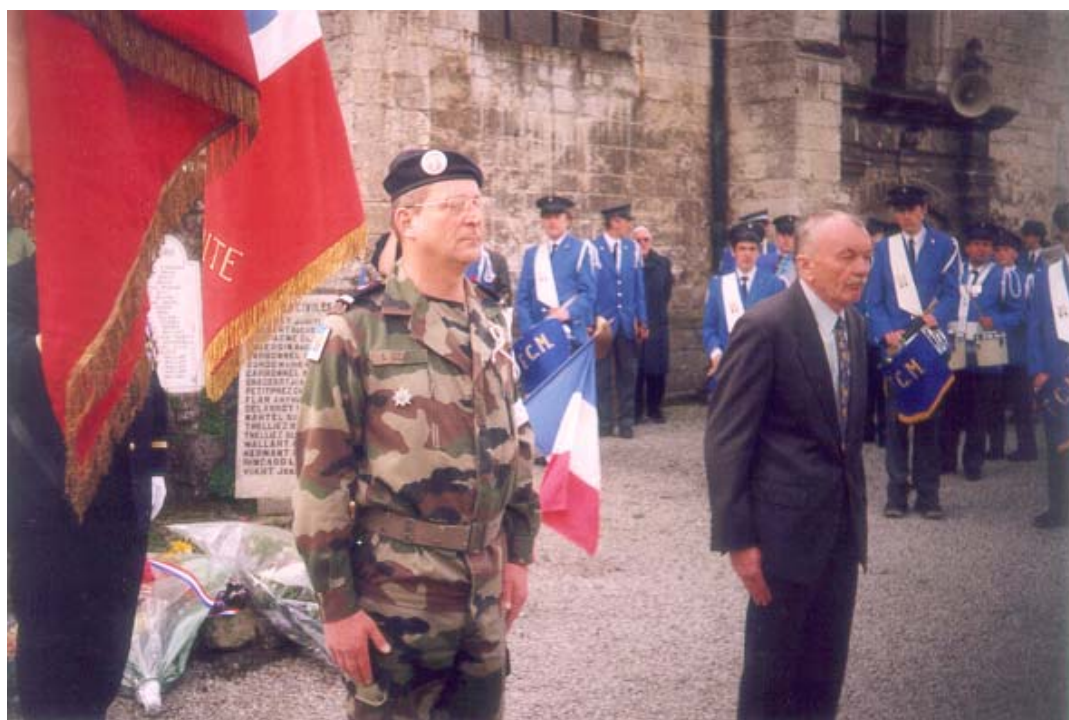
Remise des médailles aux 2 récipiendaires