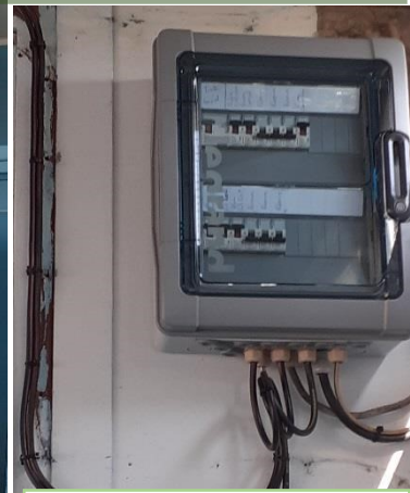
Mise en conformité du coffret électrique du préau de l'école Daudet Perrault