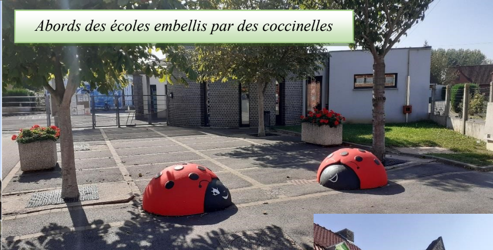
Abords des écoles embellis par des coccinelles