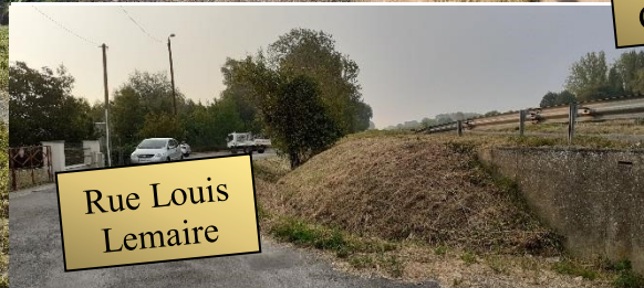
Rue Louis Lemaire