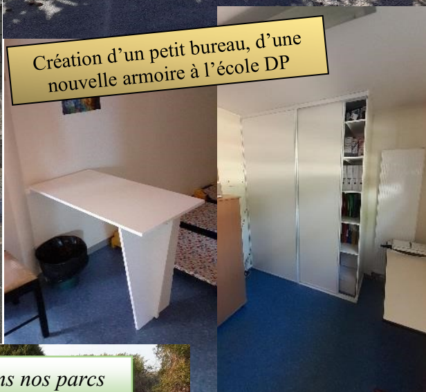
Création d'un petit bureau, d'une nouvelle armoire à l'école DP