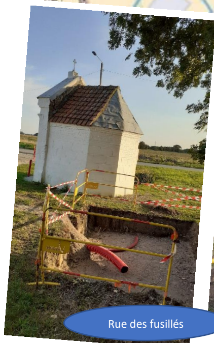
Rue des fusillés