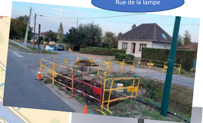
Rue de la lampe

Comme vous avez pu le constater, quelques rues du village demeurent en travaux. Des tranchées sont apparues en bordure de la rue des Métallos, de la rue du Vieux Pont, de la rue des Fusillés en transitant par la rue de la Lampe côté parc. Ce chantier qui traverse notre village constitue le renouvellement du réseau HTA (haute tension) avec enfouissement des câbles et dépose du réseau HTA/A avec suppression des pylônes concernés suivant la carte ci-dessous. Deux transformateurs seront installés : un premier rue des Métallos et un second derrière la stèle de la rue des Fusillés. Les travaux sont réalisés par l'entreprise Verrier de Ruitz. La dépose sera réalisée dans le premier semestre 2021. En raison d'une date de commencement des travaux plus précoce, nous n'avons pu prévenir les riverains. Veuillez nous en excuser.