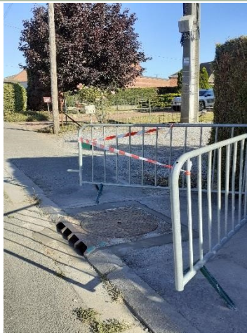
Réparations des bouches d'eaux pluviales