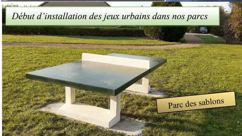
Début d'installation des jeux urbains dans nos parcs