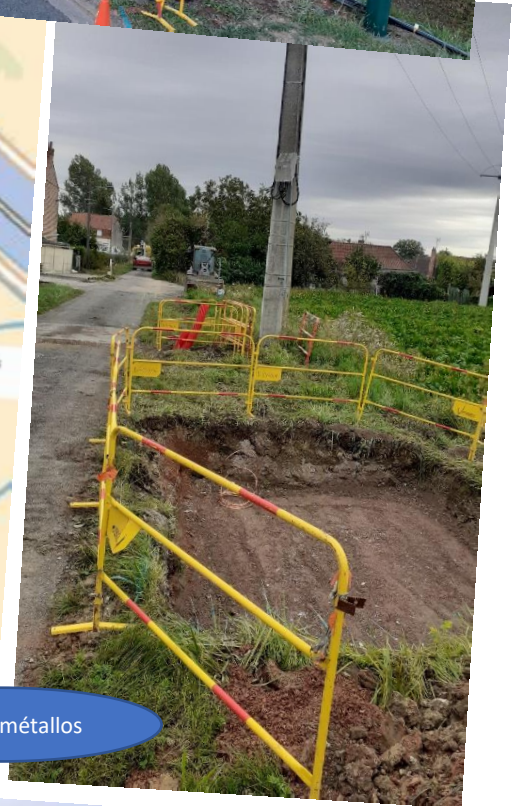
Rue des métallos