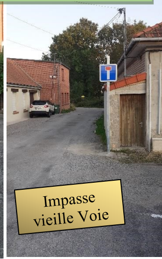
Impasse vieille Voie